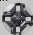
16" 205/65 R16 Aluminio Rueda de repuesto temporal