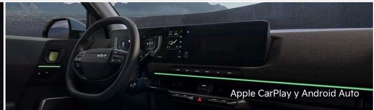
Apple CarPlay y Android Auto