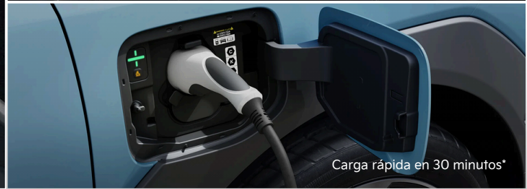
Carga rápida en 30 minutos*