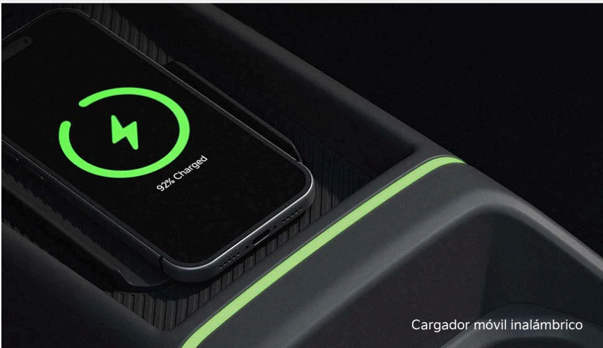
Cargador móvil inalámbrico

Libera espacio en la consola central y crea una cabina más limpia, intuitiva y moderna.