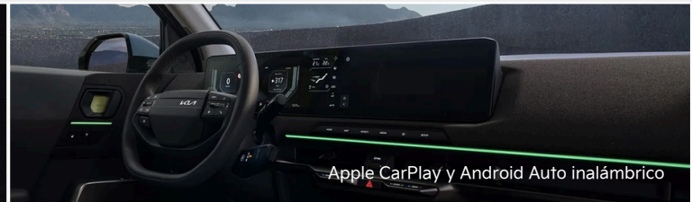
Apple CarPlay y Android Auto inalámbrico